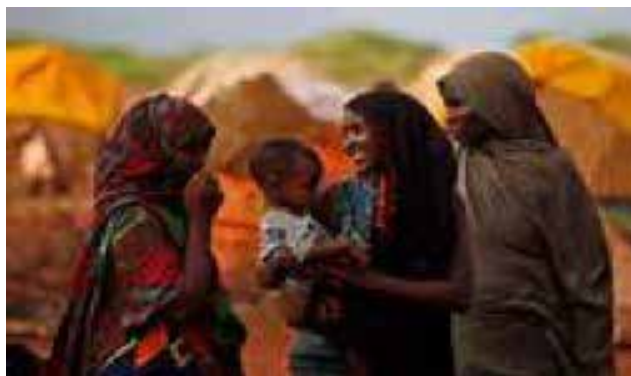
Mujeres somalís compartiendo un momento apacible delante de sus chozas portátiles.

La mayor parte del norte de Kenia es una tierra árida, abrasada por el sol ecuatorial. En ocasiones, no llueve durante meses o incluso años. Los paisajes varían de campos escarpados de ceniza volcánica a zonas intransitables de dunas y ruda maleza donde corretean los chacales y picotean las avestruces. Sin embargo, las montañas que se elevan desde los desiertos suelen tener una vegetación frondosa. Aparte de los paisajes y la vida salvaje, la gran atracción del norte de Kenia es su gente. En un entorno duro y seco sobreviven doce tribus en el norte, incluida la tribu de pescadores Turkana, cerca del lago que lleva su nombre, los cuidadores de camellos Samburu (cercanos a los Maasai), los agricultores Burji, los ganaderos Boran, los criadores de camellos Gabbra y los nómadas Rendille, que también crían camellos.