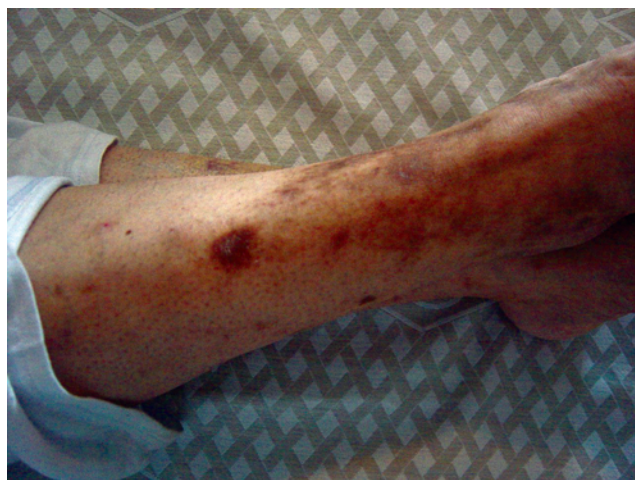
Cicatrizes em “mortalha de cigarro”.