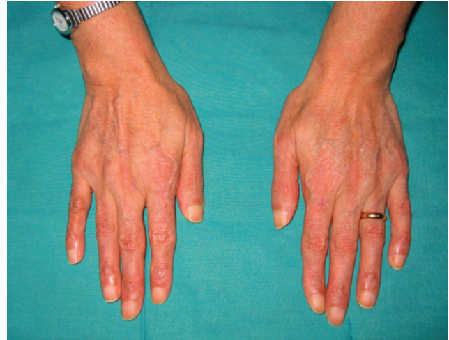
Acrogeria das mãos.