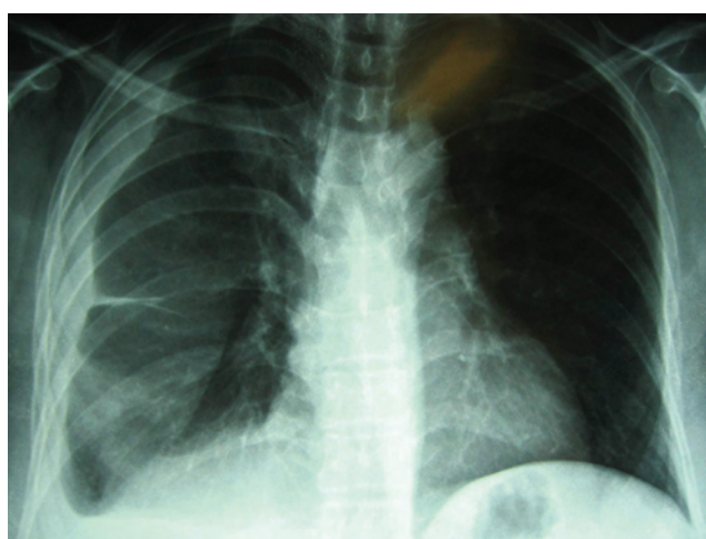
Radiografia do tórax à entrada dos HUC, mostrando oclusão do seio costofrénico direito e cisureite homolateral.