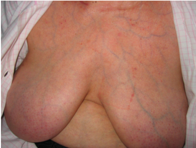
Pele fina e translúcida, com visibilidade da vasculatura.