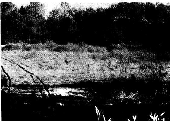
Foto 2 - Depressão interdunar coberta por Ciperáceas e algumas outras espécies higrófilas, na actualidade.

No entanto, pensamos que a grande esperança da diversificação desta mata reside na ocupação das depressões interdunares, em função das suas condições hidrológicas próprias. No final do Verão de 1995, terminus de um período de três anos secos, verificámos a manutenção de humidade nas areias do fundo de várias depressões, humidade correspondente a 2-3% do peso em água, a partir de 1 a 40 cm de profundidade. De igual modo, a toalha freática achava-se entre 1,10 e 2,25 m de profundidade, ou seja, suficientemente próxima da superfície para ser alcançada pelas raízes de espécies arbóreas higrófilas. Em regra, as depressões onde estas condições se verificam, registam a presença de espécies herbáceas higrófilas - Schoenus nigricans