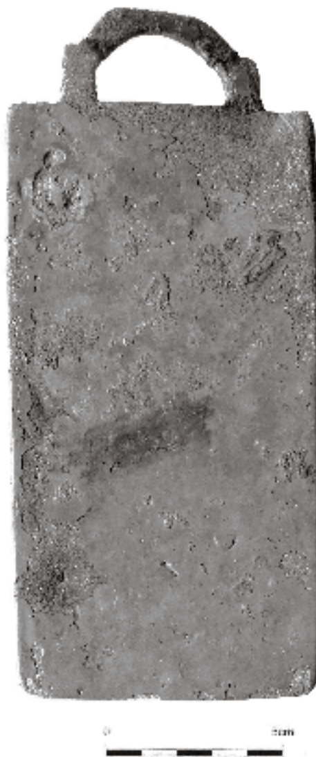
Fig. 2 A face posterior da tésseira.

A moldura, que não foi ‘soldada’ — facto que não é de somenos, uma vez que as peças deste género que se conhecem ou têm moldura que foi fixada ou não a têm —, dado que a placa-suporte deve ter sido feita em molde, apresenta-se em jeito de dois toros separados por meio-redondo côncavo, não muito salientes, porém: estão a cerca de 2 mm acima da superfície epigrafada; mede 0,6/0,8 cm de largo; mas, no bordo superior, a moldura é lisa e tem 0,9 cm de largura.