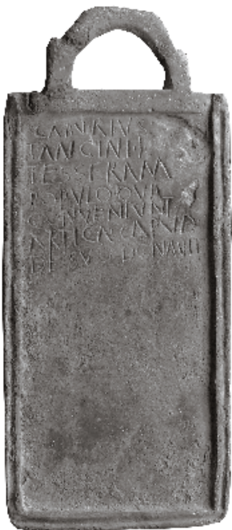
Fig. 1 A tésseira.

Propriedade de Joaquim Pessoa 2 , que a adquiriu a quem a terá encontrado, no princípio da década de 80, no termo de Campo Maior (Alto Alentejo), a tésseira que nos vai ocupar é uma placa rectangular, de bronze, moldurada, com anel para suspensão na parte superior (Fig. 1).