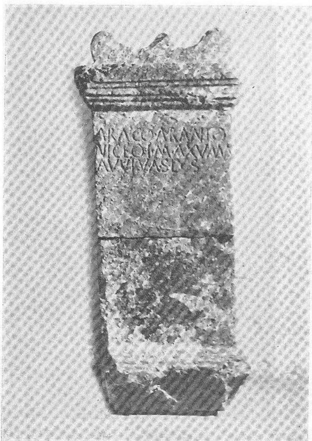
FIG. 1 — Ara a Aracus Arantus Niceus

— Arentiae Equotullaicensi , honrada por Níger, filho de Arcão, em Sabugal. FE 27.