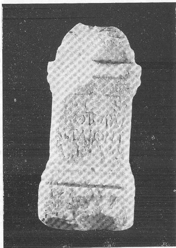
FIG. 3 — A árula verosimilmente dedicada ao deus Carneus