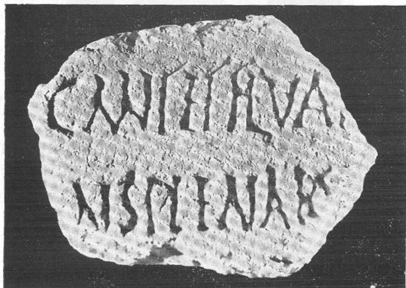
FIG. 6 — Fragmento dum eventual «cântico» a Endovélico (CIL II 6333 b)