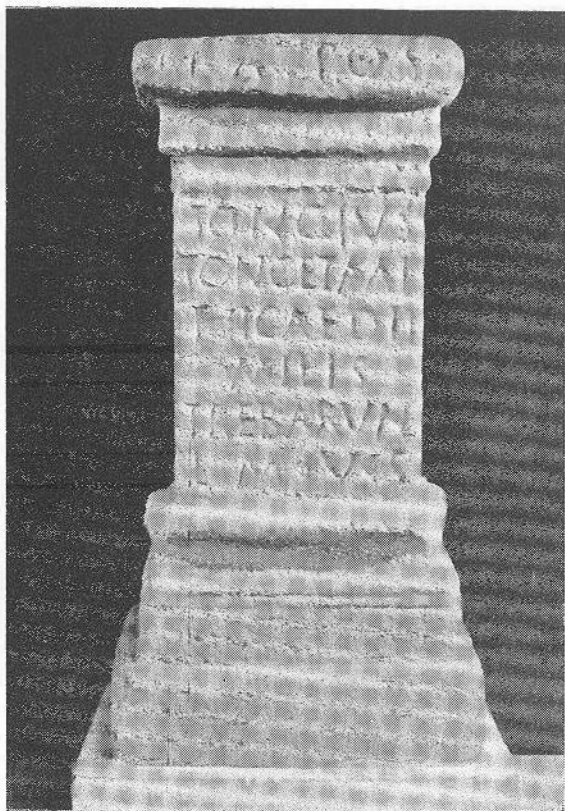
FIG. 8 — Ara a Trebaruna