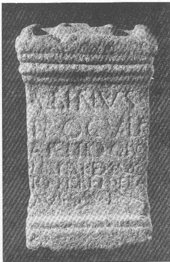
FIG. 2 — Ara a Arentius Cronisensis