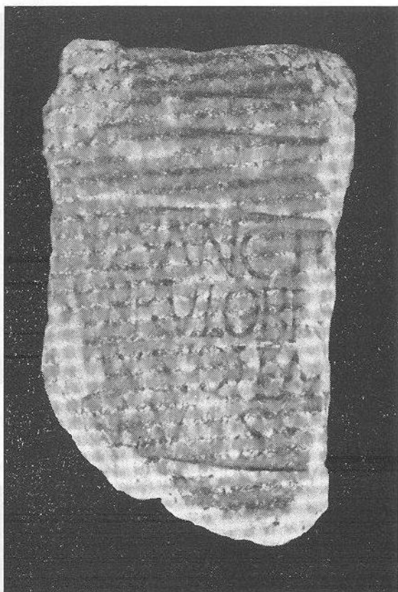
FIG. 4 — A ara à Deusa Santa Burrulobrigense