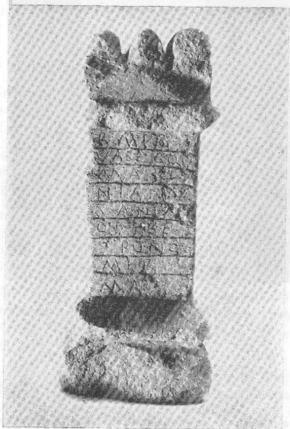
FIG. 9 — A árula a Vasecus

DIP, p. 296-7. Cf. J. Cardim RIBEIRO in «Conimbriga», XXIII, 1989.