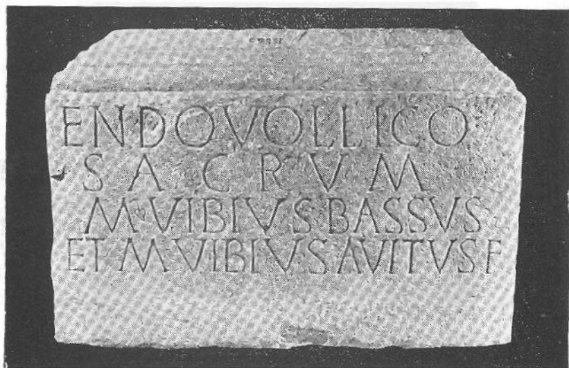
FIG. 5 — Um pedestal de estátua a Endovélico