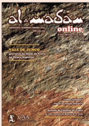
Capa | Jorge Raposo

Complexo conjunto de motivos da Idade do Ferro, gravados por incisão em rocha localizada em Vale de Junco (Sebadelhe, Vila Nova de Foz Côa). Fotografia © Filipe Alves Pina e Mário Reis.