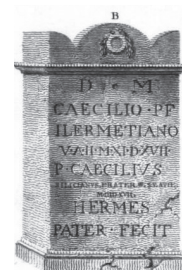
Fig. 2 – Desenho do álbum de James Murphy.

tados por (dir-se-ia) quartos de esfera, que sofreram (mormente os de trás) fraturas que os deixou incompletos. No frontão, os traços do gradim emprestam à superfície uma beleza que faz ressaltar a singela decoração, constituída, ao centro, pelo que poderia considerar-se a estilização linear de uma grinalda ou de uma coroa (com 4,9 cm de diâmetro), donde saem pecíolos, três de cada lado e dois para o interior, em baixo. A essa linha inferior se prendem, em delicada ondulação horizontal, os pecíolos de duas heras bem cordiformes, que vão aninhar-se na face dos dois 'toros' laterais (distância máxima entre as hederae : 22,2 cm) 1 . Na molduração que separa o capitel do fuste à platibanda segue-se uma gola direta. Na base: gola reversa separada do soco por ranhura. Ostenta o soco, em jeito de decoração, os traços do gradim, de orientação predominante da direita para a esquerda, de cima para baixo. Na face lateral esquerda, em relevo, um jarro do tipo urceus (Fig. 3), mais requintado, porém, do que Hilgers apresenta sob o n.º 20, documentado na Casa de Menandro, em Pompeios 2 .