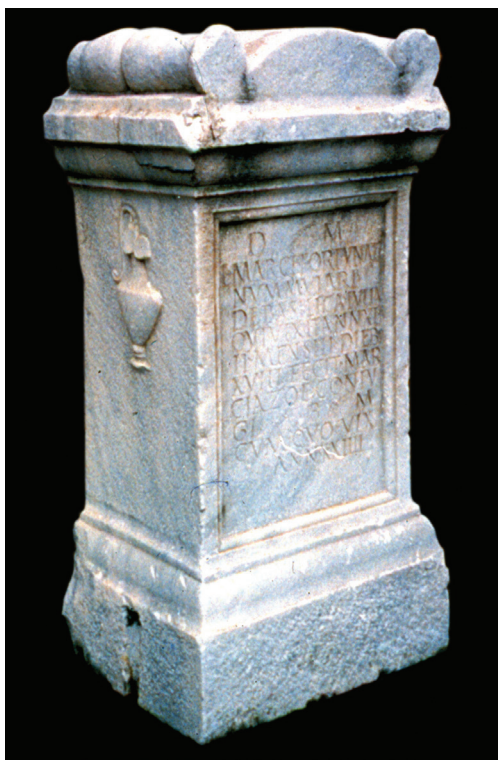
Fig. 6 – Ara do Vaticano ao marido de Marcia Zoe.

Se as diferentes leituras da l. 3 se devem ter mais na conta de gralhas do que de propostas sérias de nova interpretação, o que se passa com a l. 6 resulta da circunstância de essa linha ter sido gravada em letras miudinhas, aprovei- tando o espaço disponível — daí, por exemplo, a opção de Jordão em ler SVAVISSIMVS (Fig. 9). Em todo o caso, AEIVS lê-se bem e, na ver- dade, essa grafia (por eius , «dele»), o genitivo do pronome demonstrativo is ) pode ter causa- do alguma perplexidade, ainda que seja fenómeno gramatical outras vezes documen- tado, ae pelo som e , como, de resto, também o contrário é verdadeiro (cf. CIL II, p. 1182). A idade, minuciosamente indicada em relação a ambos os defuntos, representou para o lapi- cida excelente desafio, de que bem se desem- penhou, inclusive não omitindo a pontuação, na