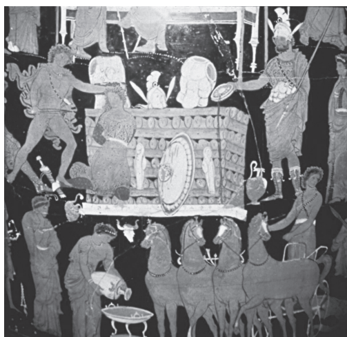
Fig. 5 — Preparativos para o ritual da purificação. Pintura de um vaso grego.

3 Agradeço a André Carneiro a gentileza de ter procedido, no Museu de Évora, à medição do monumento.