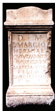
Fig. 7 – Ara do Vaticano ao filho de Marcia Zoe.

l. 6, para que tudo ficasse muito claro 6 . Aliás, outro tanto não ocorreu no caso do artista que desenhou para Murphy, porque não só não entendeu a palavra AEIVS como se viu forçado a completar o texto numa linha suplementar que acrescentou. O número de meses é três (e não quatro) e, em relação à menção dos dias, importa dizer que o D está gravado na linha, mas o numeral ocupa o espaço interlinear 6. Hesito em indicar VI ou VII, porque se me afi- gura que o segundo I poderá estar no rebordo que lascou; inclino-me mais para VII, no que sou seguido por Hübner e por Vieira da Silva; Hüb- ner põe VII como se estivesse gravado no segui- mento da l. 5, o que não é correto.