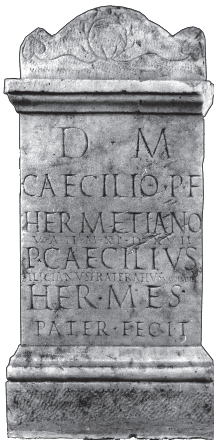
Fig. 1 – Ara de Olisipo.

O capitel apresenta toro central em jeito de dorso de abóbada, com os quatro cantos rema-