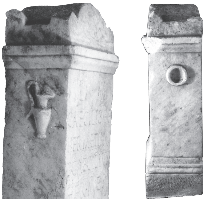
Fig. 3 — O jarro — decoração da face lateral esquerda.