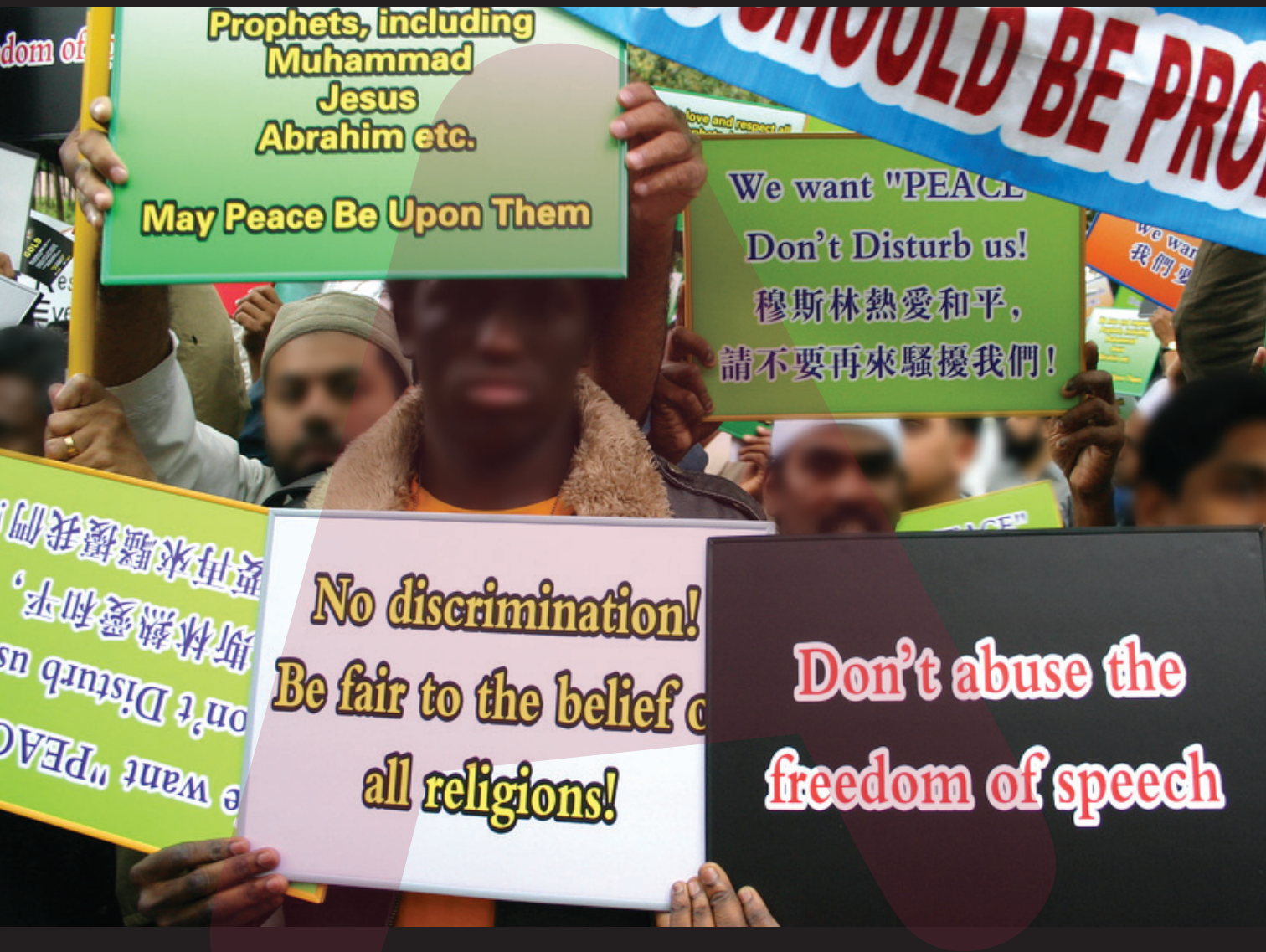
(Anti)racismo e liberdade de expressão - Protestos em Hong Kong (17 de fevereiro de 2006) contra a publicação das caricaturas de Maomé no jornal dinamarquês Jyllands-Posten .