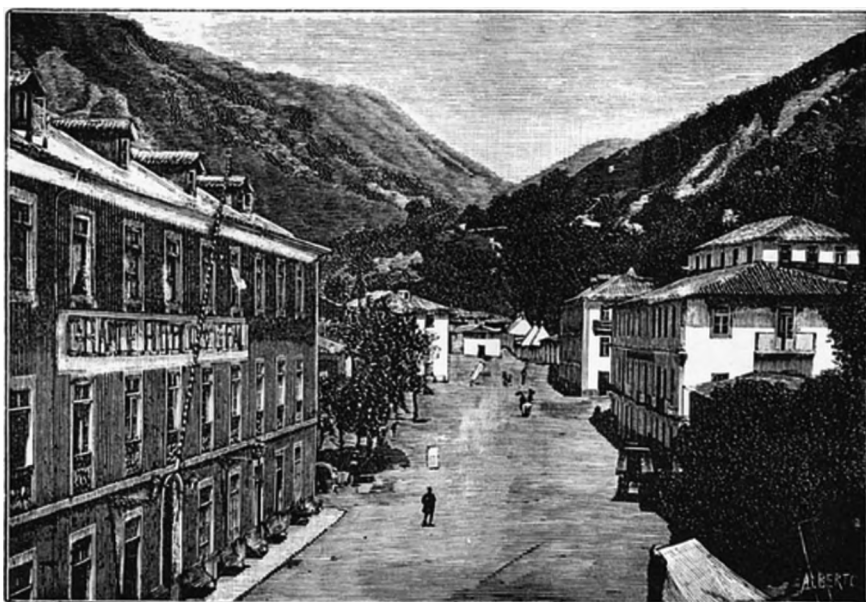
Figura 3. Aspecto das Caldas do Gerês em 1891. Fonte: Jorge, Ricardo. Caldas do Gerês. Guia termal. Porto: Tip. da Casa editora Alcino Aranha; 1891, [s.p].