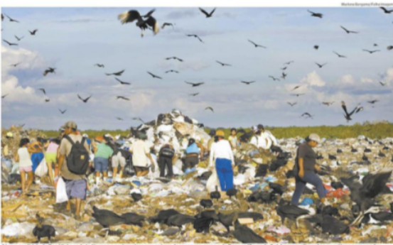
Aterro sanitário de Boa Vista onde indígenas e garimpeiros que saíram de reservas, como a Raposa/Serra do Sul, buscam alimentos ou artigos para vender

Segundo outros cidadãos, os moradores das reservas aparecem por dois motivos. Um é que pagam ao atendente para vender e comprar roupas. Também trocam farinha com outros frequentadores do aterro pelo grão de café que os moradores vendem. "Eles vendem o milho para se alimentar de sal", diz Assis. Outros dizem que uma mulher abusou a cabeça quando perdeu a cabeça da esposa. Ela, em sua vida, nunca mais voltou, exceto a noite com