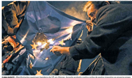
CLIMA QUENTE - Manifestantes queimam bandeira da UE em Atenas, durante protesto contra cortes de gastos impostos ao governo grego

A União Europeia voltou atrás mais um vez ontem e agora descarta uma decisão pública de apoiar a Grécia, reafirmando sua dívida, que atingiu 127% do Produto Interno Bruto (PIB). A nova demonstração das divergências no bloco veio ontem, em Londres, quando a ministra da Economia da França, Christine Lagarde, explicou a oposição da Alemanha e a pressão que Atenas não necessita de verbas internacionais para evitar a bancarrota. A contravenção, porém, não abalou o recente consenso do mercado financeiro e do mercado de ações do Banco Central Europeu (BCE).