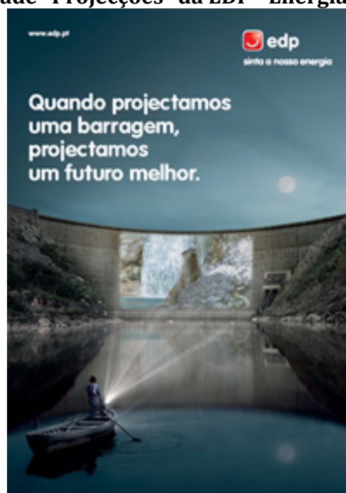
Figura 1 - Publicidade "Projeções" da EDP - Energias de Portugal