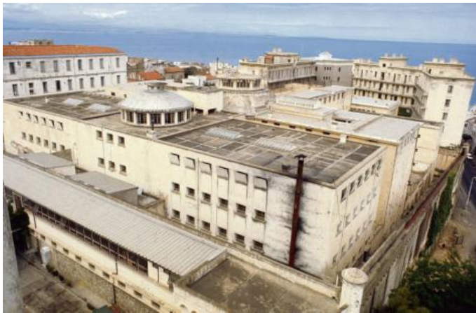
https://www.humanite.fr/sites/default/files/images/43021.HR.jpg Rue des Archives/Tallandier

TRAMOR QUEMENEUR VENDREDI, 24 JUIN, 2016 L'HUMANITÉ