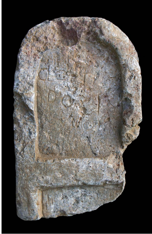
Figura 7. Estela funerária de Cloutius Doci.