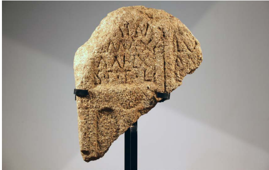
Figura 5. Fragmento de estela funerária dupla.

vação da cartela do lado direito não permite a restituição do nome do defunto, nem da idade de falecimento. Uma fórmula funerária corrente, que ordinariamente se apresenta por meio das siglas S. T. T. L., surge a rematar ambos os epitáfios. Possivelmente, também ambos os textos estariam encabeçados pela consagração aos deuses Manes. Este facto, associado à utilização da fórmula final S. T. T. L., permite considerar a estela datável do século II ou inícios do III, mas não posteriormente, considerando o muito provável estatuto jurídico dos defuntos: peregrini , apesar da abreviatura dos antropónimos. Esta convicção baseia-se no facto de a abreviatura da primeira forma antropónimica do texto da cartela da esquerda facilmente se enquadrar com um antropónimo indígena tipicamente lusitano com representação no âmbito regional 31 , ainda que a grafia com -i- , claramente atestada no interior da Lusitânia, seja inédita a norte do Douro. Concomitantemente, resulta menos evidente um eventual desdobramento em função de um gentílico, ainda que se reconheça a existência do nomen latino Caenius 32 , aparentemente indocumentado na Hispânia 33 . O antropónimo latino que, dubitativamente, se sugere para o patronímico é dos mais difundidos na Hispânia 34 .