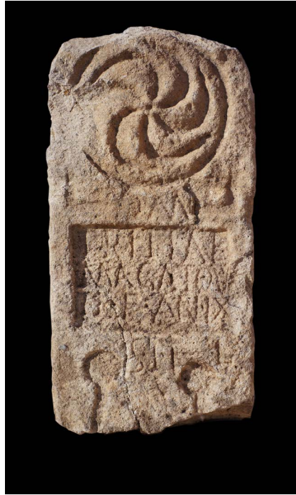
Figura 6. Estela funerária de Tritia Magatouti f..

A datação da inscrição corresponderá ao século II ou início do século III, tendo em vista o estatuto jurídico da defunta e o facto de o seu nome surgir em dativo, associado à consagração aos Manes e à fórmula final S. T. T. L.