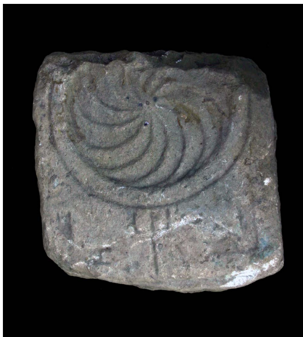
Figura 8. Cabeceira de estela funerária (© A. Redentor).

Tendo em atenção a possibilidade de inserção tipológica acima enunciada, enquadrar-se-ia nos séculos II-III.