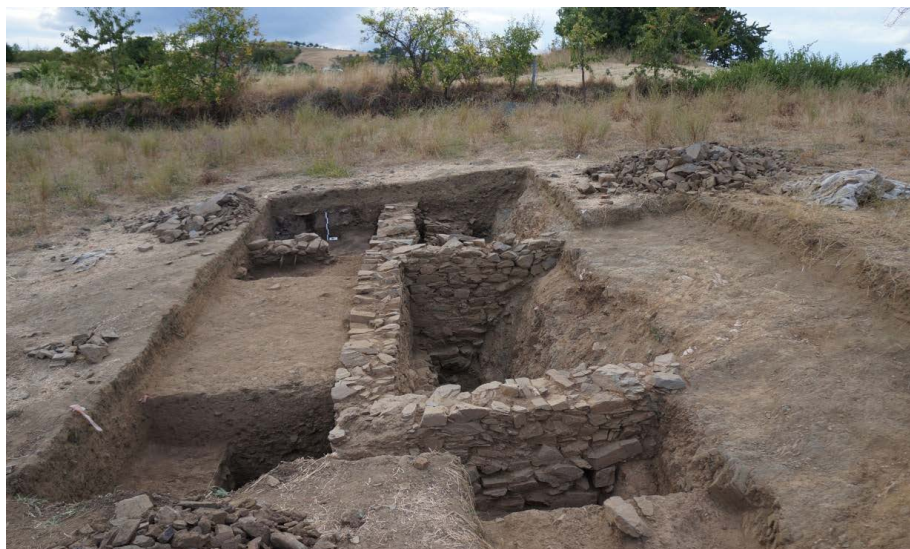
Figura 2. Perspetiva das fundações de um “edifício flaviano”: sondagens AA AB 40 42 – quadrante sudeste da Torre Velha.

cados em escavação. De um deles, situado nas terras mais baixas, na parte mais oriental (quadrante sudeste) da Torre Velha, restam as sólidas fundações, sendo talvez de âmbito privado, objeto de alterações no Baixo-Império 13 . O outro, descoberto na parte mais elevada e ocidental deste local, face às suas dimensões e características construtivas (e à sua implantação numa zona que consideramos central do sítio), parece poder inscrever-se no âmbito da arquitetura pública.