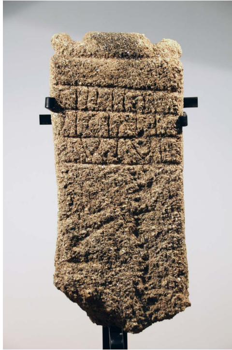
Figura 4. Ara funerária de Celser Licini.

próximo ao do popular nome indígena Reburrus 29 , aspeto que poderá justificar o seu aparente sucesso neste contexto geográfico, em resultado de um mecanismo de tradução. O modo de menção da idade e o próprio tipo de suporte indiciam cronologia posterior aos inícios do século II, ainda que o facto de se utilizar o nominativo na identificação do defunto possa centrar nesta centúria o monumento.