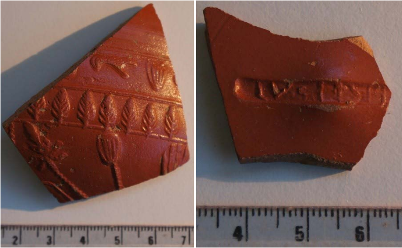
Figura 3. Fragmentos de sigillata da primeira fase da produção hispânica: o primeiro, possivelmente, de uma Drag. 29; o segundo, com marca, aparentemente de Lucius Sempronius , um oleiro de Trício (© P. C. Carvalho).

dos ateliers do vale do Ebro, surgindo com muito menos frequência as do vale do Douro), sendo muito escassos (mas surgem aqui pela primeira vez representados) os fragmentos de sigillata gálica e de sigillata africana A e D. Ao mesmo tempo, entre as cerâmicas finas, encontram-se algumas peças produzidas em Lugo (cerâmica de engobe vermelho) e Braga (lucernas), para além de alguns exemplares provenientes do vale do Tera (Zamora), incluindo cerâmicas de paredes finas da oficina de Melgar de Tera 15 .