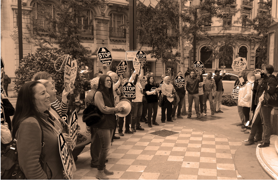
Figura 1. Acción protesta de Stop Desahucios-15M Granada frente a entidad bancaria Foto: elaboración propia.

La composición de cada asamblea es variada, pues la lucha por el derecho a la vivienda ha afectado tanto a clases populares –trabajadores de la construcción y el sector servicios, principalmente– como clase media –pequeños empresarios, profesionales liberales– y población en riesgo de exclusión social –población gitana, migrante y empobrecida–. Su diversidad y pluralidad se reflejan también en la falta de un programa político preconcebido y de un horizonte ideológico concreto; de alguna manera, el grupo es: