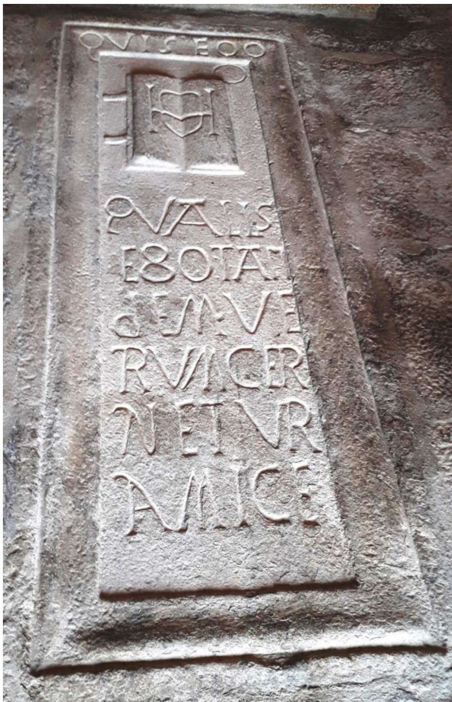
Figura 5. A lápide na sua totalidade. Fonte: JCS

O texto lê-se sem dificuldade (Figura 5):