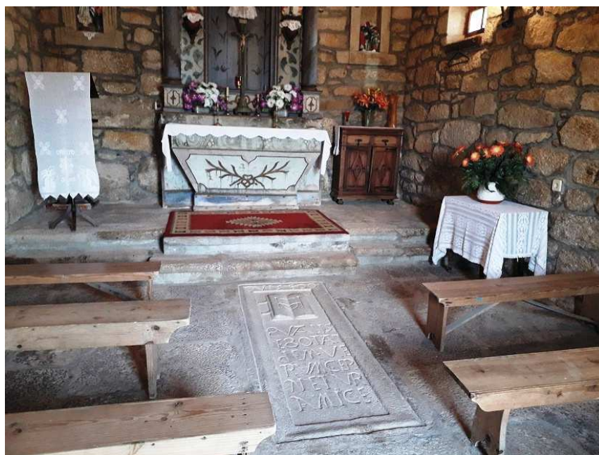
Figura 2. A localização da lápide na capela.

em Arcos, concelho de Tabuaço, frente ao altar, uma placa (Figura 2)