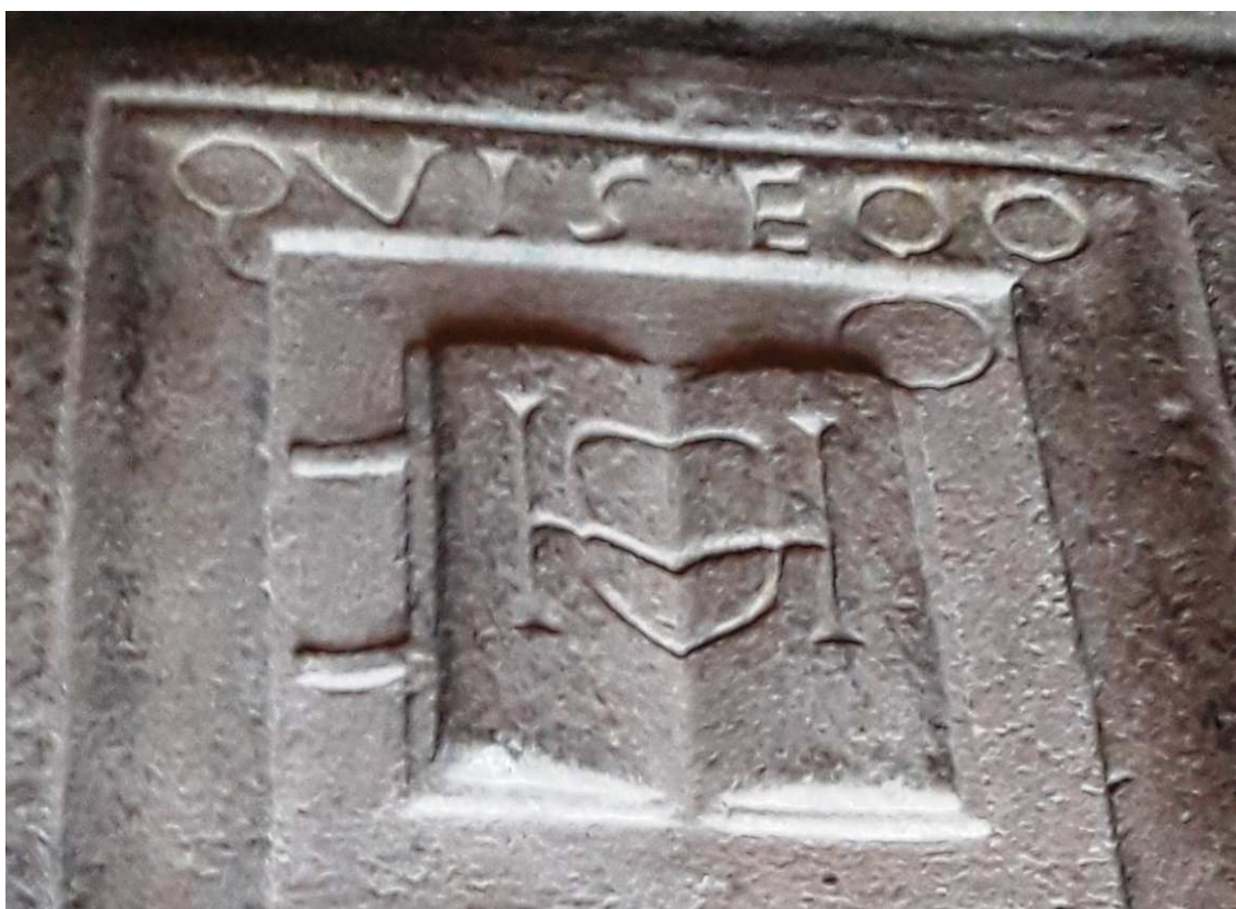
Figura 4. A parte superior da lápide, com o pormenor do livro.

O espaço que contém a inscrição foi rebaixado em relação à moldura do tipo gola directa com filete exterior que o limita. Aliás, a primeira linha do texto foi gravada nessa mesma moldura; antes, porém, da linha 2, está esculpido ao centro, em relevo, um livro aberto (Foto 4), que poderá representar um missal e que tem, do lado esquerdo de quem olha, paralelas e também esculpidas em relevo, duas fitas, em jeito de marcadores de página.