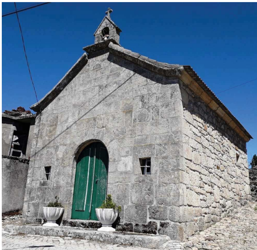
Figura 1. A capela de Santo António.

Encontra-se no chão da zona central da capela seiscentista de Santo António (Figura 1),