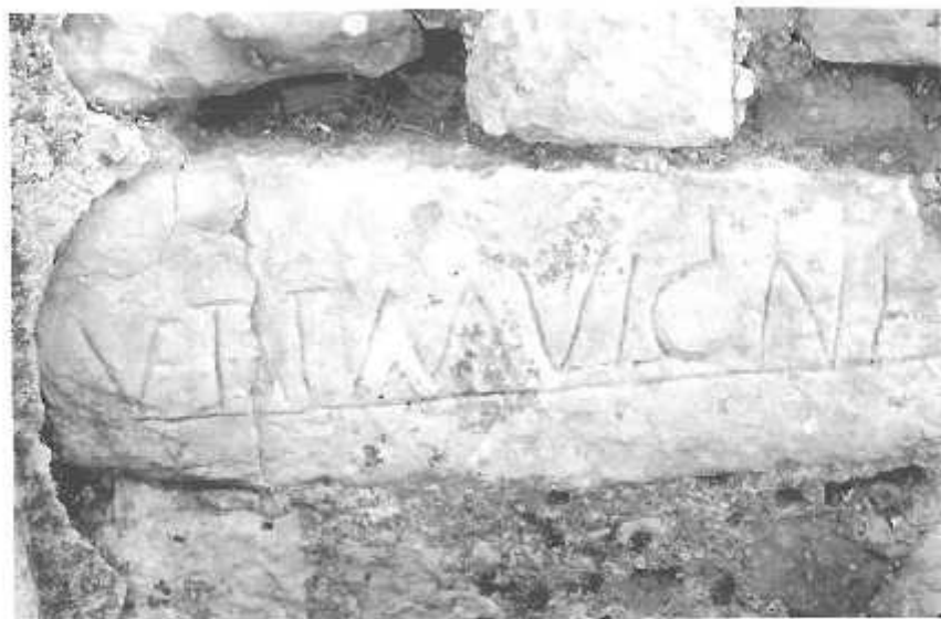
Foto 2 - O bloco epigrafado