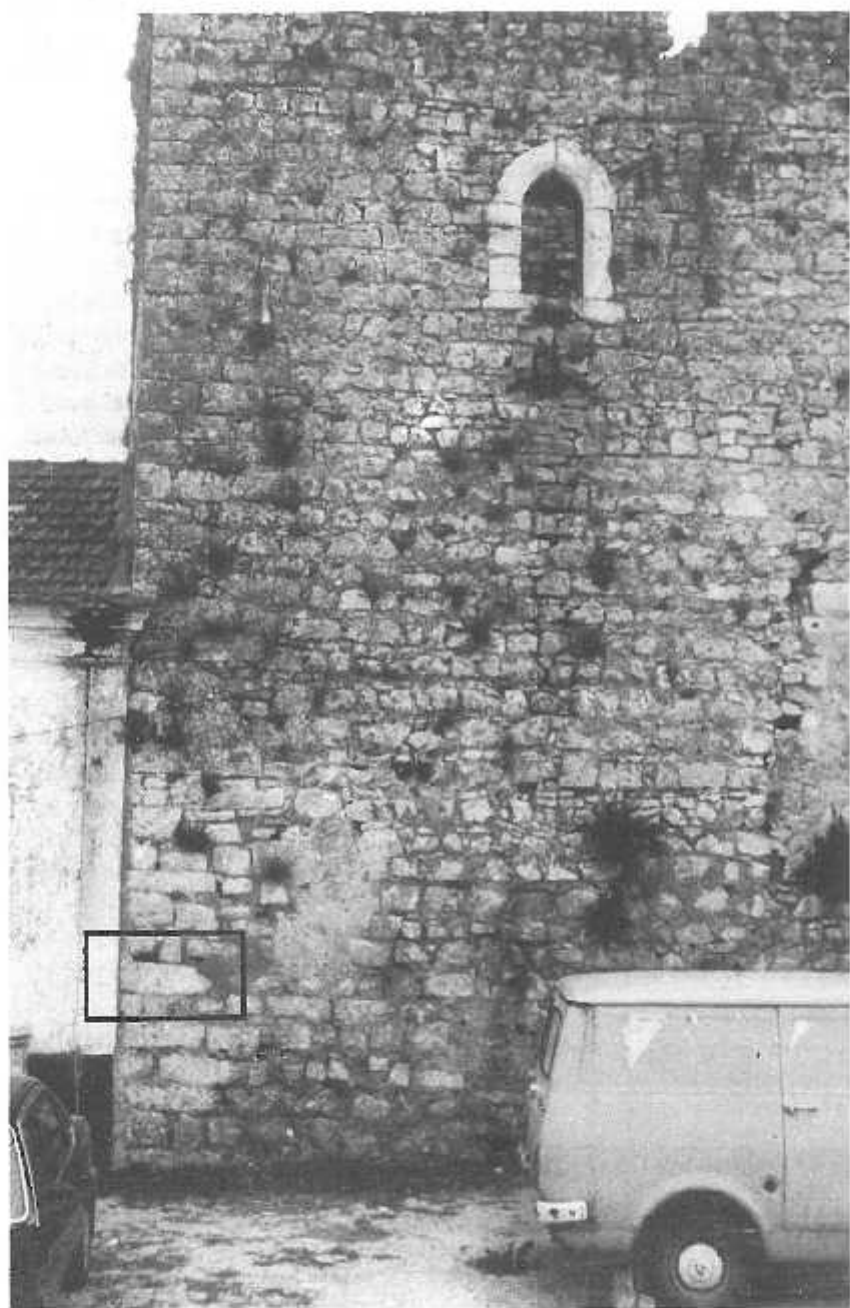
Foto.1 - Localizãõ da epigrafe.