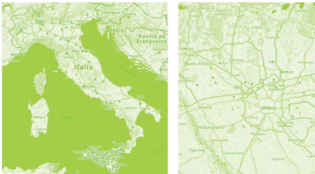
Рисунок 1. Карта практик ПБ в Италии с 2014 по 2018 годы (метрополия Милана показана крупным планом)

экспериментальной фазы и превращение в основной консолидированный инструмент местного правительства для повышения качества жизни и планирования городской среды.