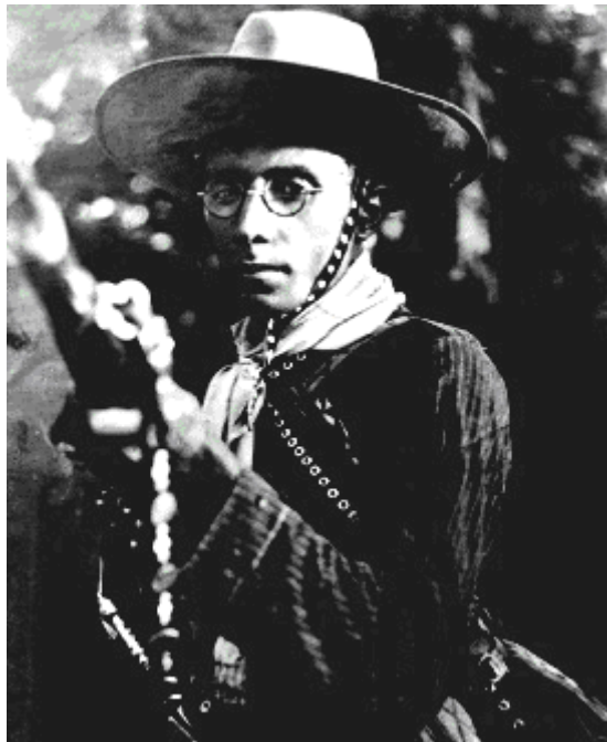
Lampião, comandante do Batalhão Patriótico. 327

Bartolomeu (braço direito de Padre Cícero) “ decide chamar Lampião com o apoio do Padre Cícero ” 326 .