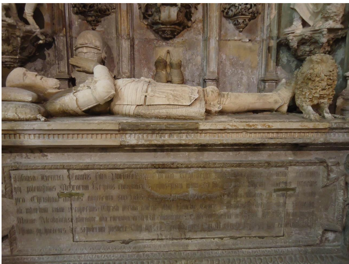
Túmulo de D. Afonso Henriques – Igreja de Santa Cruz de Coimbra.