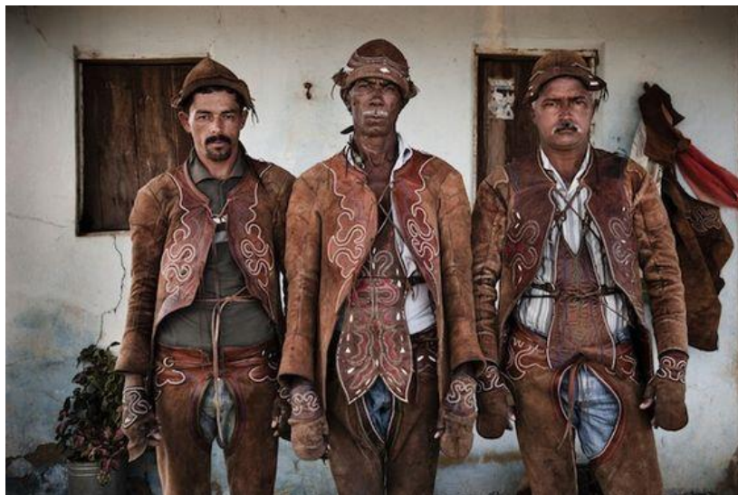
Vaqueiros Nordestinos 2