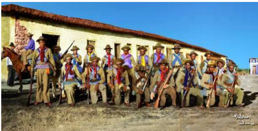
Volante do Tenente Zé de Rufino 320

A vingança no sertão era feita de duas formas: legalizada, através do ingresso na polícia (no corpo policial oficial ou nas volantes 319 ); a vingança ‘fora da lei’, essa levada a cabo pelos cangaceiros e, também, pelos jagunços.