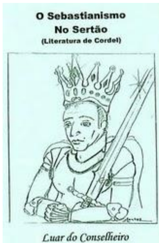
Capa do Cordel O Sebastianismo no Sertão 305