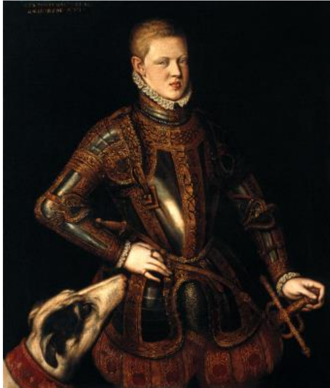
D. Sebastião. Óleo sobre tela, autoria atribuída a Cristóvão de Morais; Fonte: Acervo do Museu Nacional de Arte Antiga, disponível em: http://www.museudearteantiga.pt/colecoes/pintura-portuguesa/retrato-de-d-sebastiao

A morte do jovem rei e o desaparecimento de seu corpo deram ensejo para que as mais diversas teorias surgissem a seu respeito.