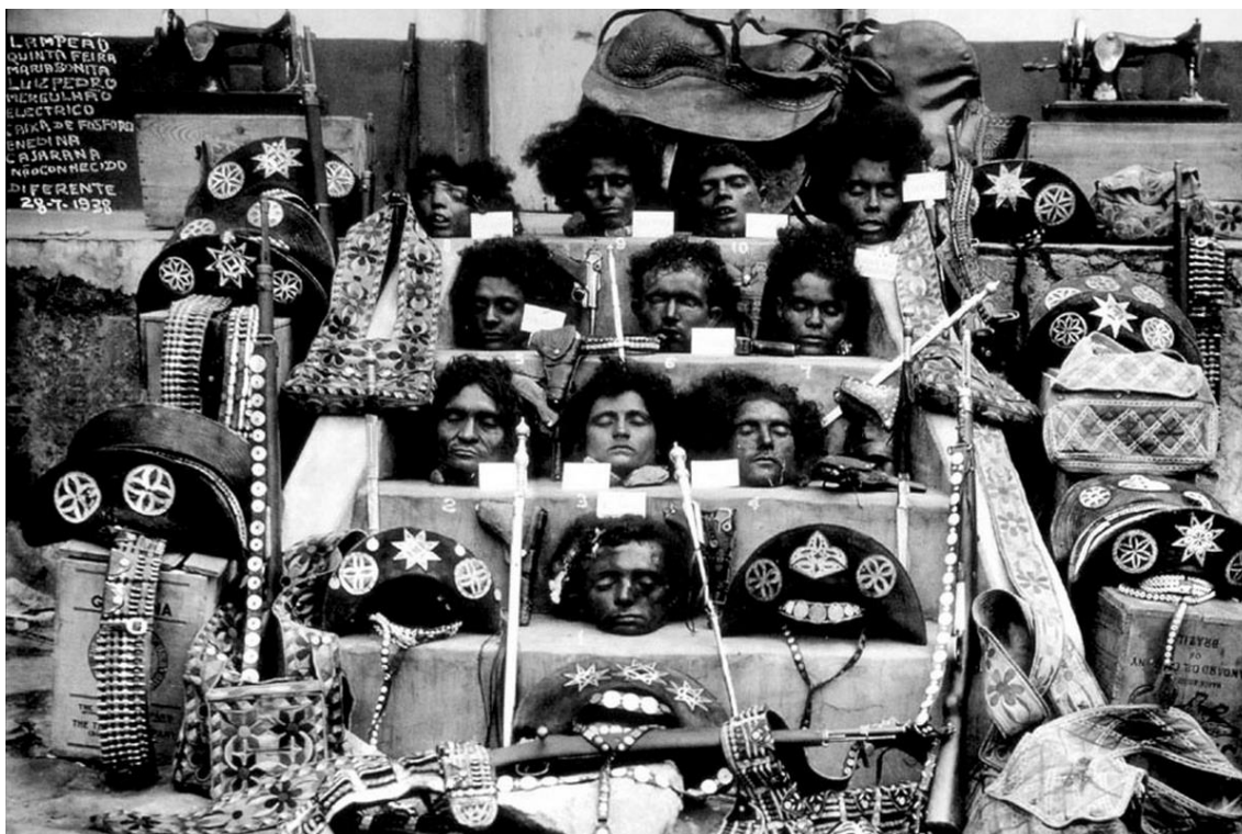
Cabeças cortadas, armas e objetos pessoais de Lampião, Maria Bonita e mais 9 companheiros. Autoria anônima, 1938. Fonte: Instituto Moreira Salles, disponível em: https://ims.com.br/acervos/

Com a morte de Lampião e, depois de um tempo, a morte de Corisco (que já não estava mais na vida do cangaço), encerrar-se-ia o movimento que deu ensejo para cantadores e poetas sertanejos e povoou (e ainda povoa) o imaginário popular das gentes do sertão.