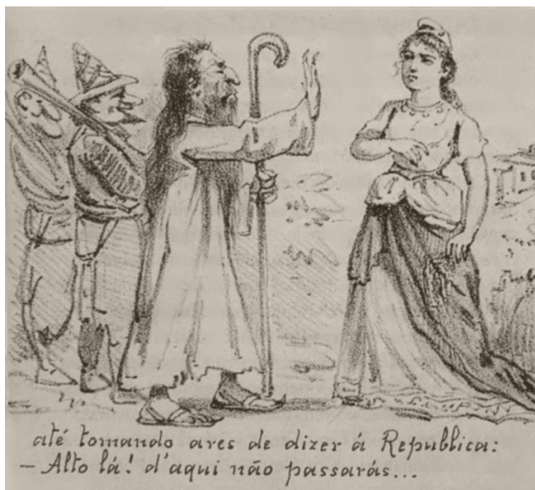
Angelo Agostini – Antônio Conselheiro rechaça a República, in Revista Ilustrada , 1896.

Durante o Império, as autoridades admitiram com benevolência o Conselheiro e seu bando, pois prestavam serviços à região, com as obras que empreendiam. Com a proclamação da República, esta situação chegou ao fim; o Conselheiro, que era contrário a toda e qualquer novidade, não podia admitir a coleção de modificações trazidas pelo novo governo: expulsão do velho Imperador, separação entre a Igreja e o Estado, impostos em muito maior quantidade, recenseamento. A condenação da República não tinha como ponto de partida princípios políticos, mas sim a consideração de que era o governo do Anticristo, o partido do demônio. O único regime legítimo era a Monarquia, em que se mantinham unidos Igreja e Estado e em que o governo estava nas mãos do Rei, representante de Deus na terra. 249