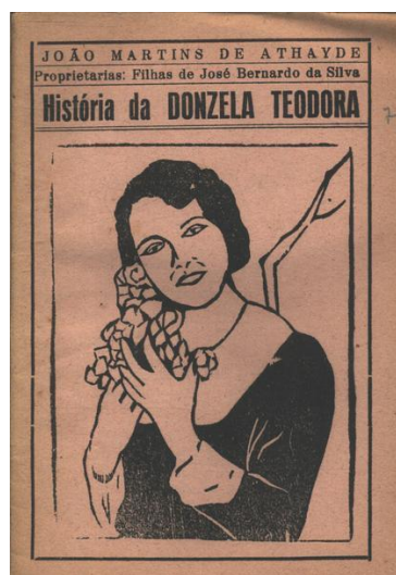
Ilustrações 7 e 8