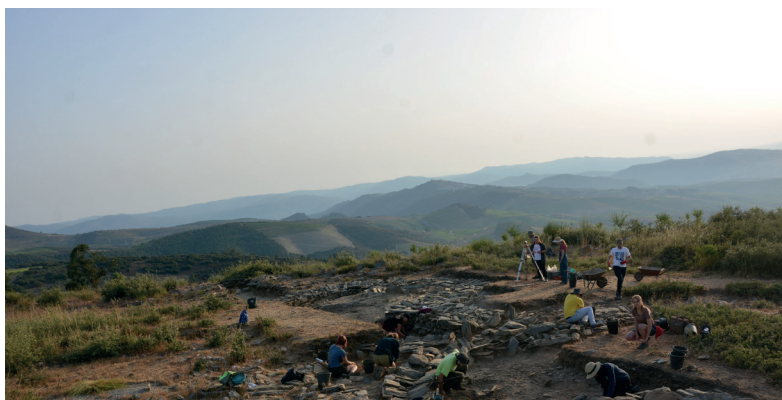
Fig. 10: Aspecto geral dos trabalhos.

A divulgação dos resultados é feita sistematicamente. Não só o relatório é publicado em revista de divulgação regional como a Côavisão, editada pela Câmara Municipal de Vila Nova de Foz Côa, como os resultados científicos são sempre que possível apresentados em congressos ou colóquios e publicados.