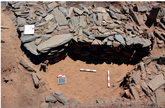
Fig. 6: Área entre o Bastião L e a Estrutura Circular 31. É visível a diferença de sedimentos entre área de influência do Bastião L (sedimentos mais escuros) e a área mais à direita, relacionada com a EC31 e a P7 (passagem 7).

b) Entre o muro 8 e as estruturas circulares 8 e 7, continuou-se a escavação do ano anterior. Tinha sido ampliada em 12m 2 , constatando-se que o depósito mantém a sua matriz argilosa compacta, de cor amarela e tonalidade alaranjada. Os materiais recolhidos são consistentes com aqueles recuperados em anos anteriores, nesta área. A fauna é abundante, designadamente junto ao muro 8, escasseando à medida que nos afastamos daquela estrutura. No centro desta área, foram detectadas pequenas zonas com um sedimento ligeiramente mais acinzentado, embora a sua matriz argilosa se mantenha, remetendo para áreas de combustão ou descarte de restos de combustão.