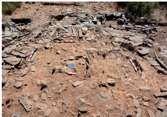
Fig. 8: Aspecto geral do Bastião M. Do lado direito a EC33, identificada durante os trabalhos de limpeza e decapagem.

d) Na última semana de trabalhos, deslocamos parte dos voluntários para a área Sul da linha 45 onde procedemos à limpeza e decapagem superficial do Bastião M. O objectivo desta acção prendia-se com a necessidade de perceber o seu alinhamento estrutural inserido no murete 3, já que em algumas áreas a definição desta estrutura era difícil de entender. Este trabalho revelou-se bastante proveitoso, pois não só se identificou no interior deste bastião uma estrutura circular (EC33), como se tornou bastante