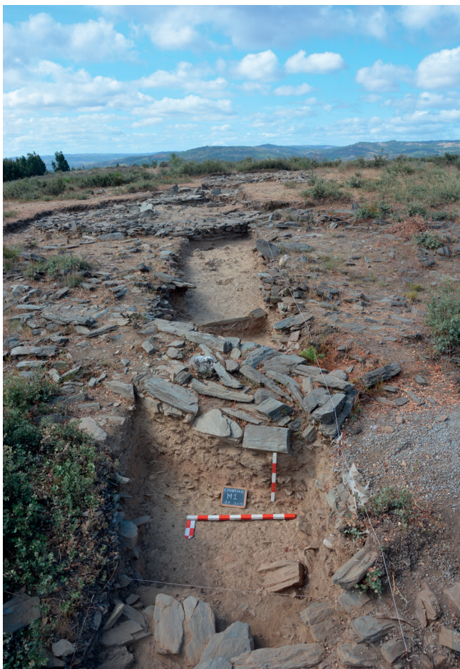
Fig. 3: Vista geral da área entre o Troço do Murete 1 e o “Bastião” L (Murete 2). Em primeiro plano é observável os depósitos que se desenvolvem abaixo do Murete 1, na área exterior ao recinto. A sequência estratigráfica na área exterior ao recinto, engloba depósitos relacionados com a construção da rampa/talude e, abaixo destes, um depósito correlacionável com os níveis dos finais do 4.º milénio / inícios do 3.º milénio AC, identificado na área interior ao recinto

Nesta campanha deu-se continuidade à escavação deste nível, tendo sido possível verificar que se trata de um depósito que cobre diretamente o substrato rochoso (Figura 5). Na área interior ao recinto, procedeu-se: à desmontagem de um aglomerado de blocos de quartzo, localizado na extremidade junto ao Bastião L; à escavação do interior de pequenos “buracos de poste”; e à escavação dos sedimentos que embalavam estas estruturas, no qual se verificou uma reduzida ocorrência de componente artefactual. No exterior do recinto, procedeu-se à desmontagem da rampa/talude (Jorge et