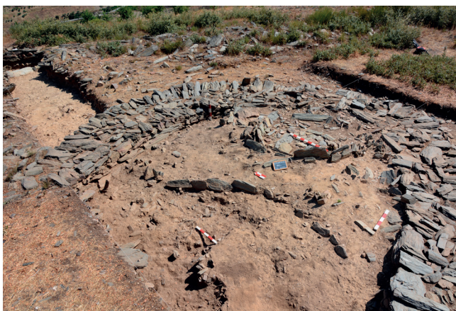
Fig. 4: Bastião L no final da intervenção.

A componente artefactual que aparece em associação a este depósitos é muito abundante: cerâmica lisa, cerâmica com decoração impressa penteadada; e alguns materiais líticos como raspadeiras, lascas retocadas e percutores. A presença de vestígios arqueofaunísticos é também expressiva, mas à medida que percebíamos que a escavação desta unidade de registo estava a terminar, a frequência desta categoria de material é menor. Este depósito assenta num sedimento argiloso, compacto e amarelado.