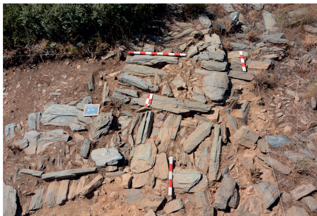
Fig. 9: Ponto de intersecção entre a parede Sul do Bastião, o segmento de murete 3 que segue para Sul e o murete 4.

claro o ponto de intersecção entre a parede Sul do Bastião, o segmento de murete 3 que segue para Sul e o murete 4. Este é o único ponto de contacto existente entre o murete 3 e o 4.