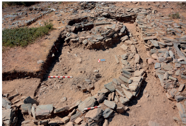
Fig. 7: Muro 8 e área entre esse muro e as EC 7 e 8. É visível diferenças de coloração sedimentar que podem corresponder a diferentes áreas de combustão e/ou descarte de restos de lareiras.

único. Por outro lado, o depósito onde esta estrutura assenta é homogéneo. É o mesmo depósito onde as construções das EC 7 e 8 arrancam.