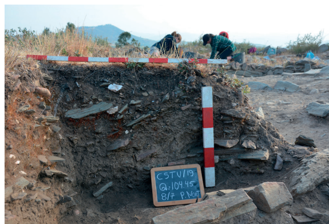
Fig. 5: A banqueta antes do início dos trabalhos de escavação.

A pequena banqueta existente no canto SO do Bastião, foi completamente escavada e todas as suas terras foram crivadas a água. O remanescente sedimentar foi analisado no laboratório do CIBIO e será objecto de um trabalho de âmbito académico acerca dos vestígios arqueobotânicos.