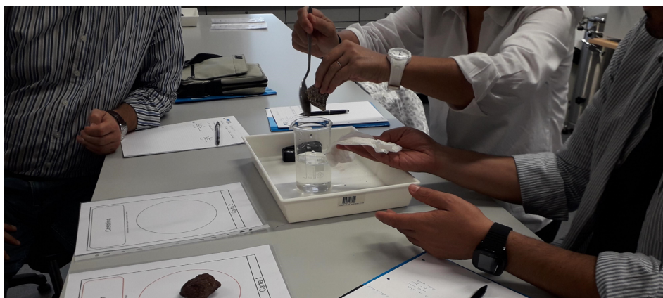
FIGURA 3. Atividade 'Detetive das rochas' integrante da oficina "As rochas: pretextos e contextos".

Ao longo das diversas sessões, os participantes, individualmente ou em grupo, foram sempre muito ativos na dinamização das atividades, o que ajudou a alcançar o objetivo de desenvolverem a prática de manipulação dos materiais, de proporcionar a intercomunicação, o questionamento e a partilha de opinião (FIGURA 3).