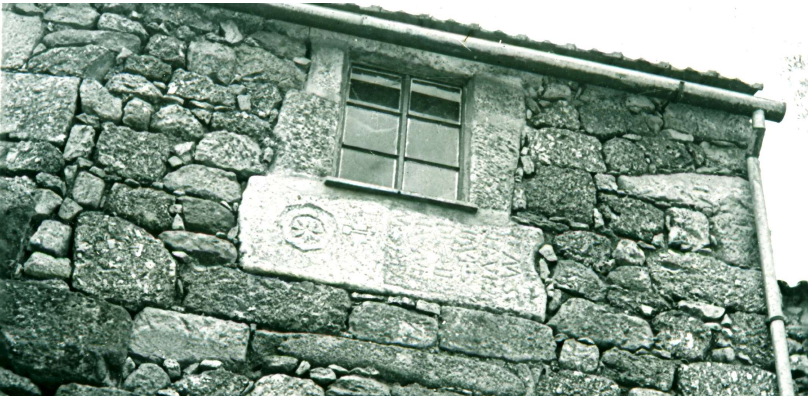
Fig. 1 - Uma estela romana a servir de peitoril