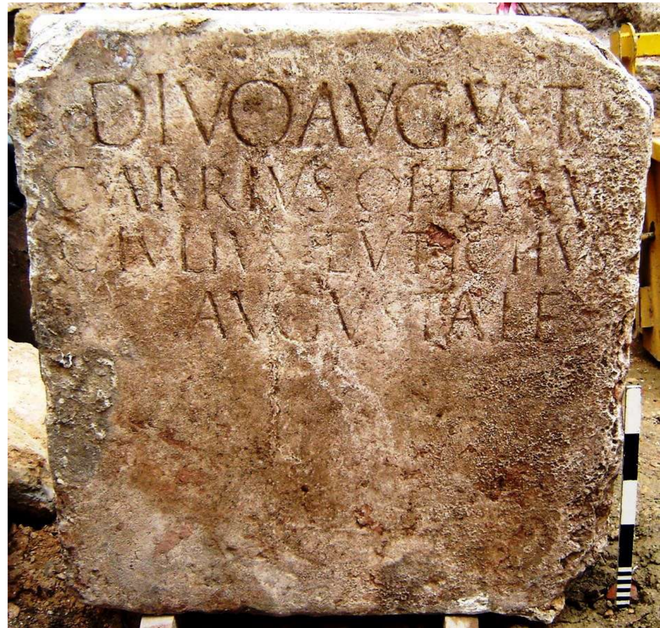
Fig. 2 - O pedestal a Augusto no momento da descoberta.