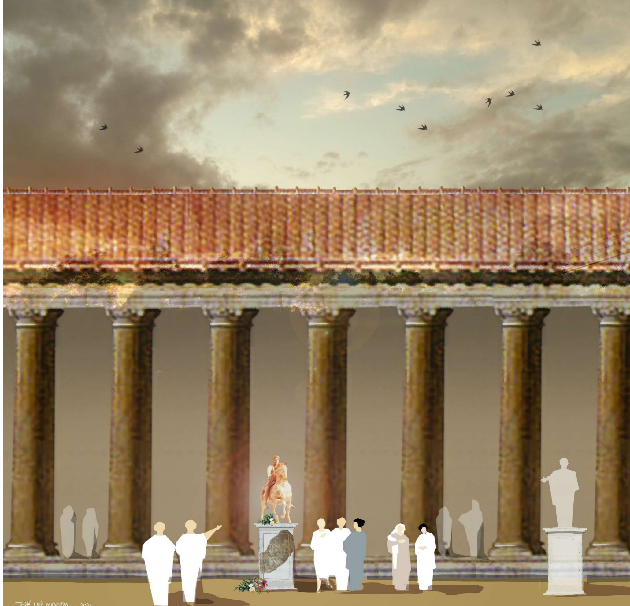
Fig. 5 - A encenação criada por J. L. Madeira para o pedestal duma estátua equestre de Pax Iúlia.